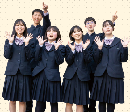
◀ 県立田村高校の 生徒会の皆さん